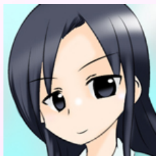
八つ宮もみじ （やつみやもみじ）